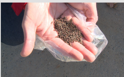
4. Seme di cavolfiore.